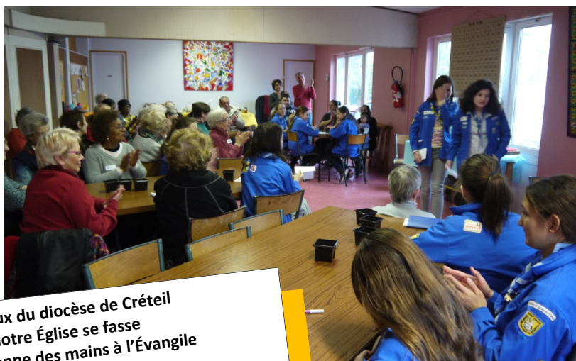
Table Ouverte Paroissiale

D32 Décrets synodaux du diocèse de Créteil pour que notre Église se fasse conversation et donne des mains à l'Évangile Prendre soin les uns des autres