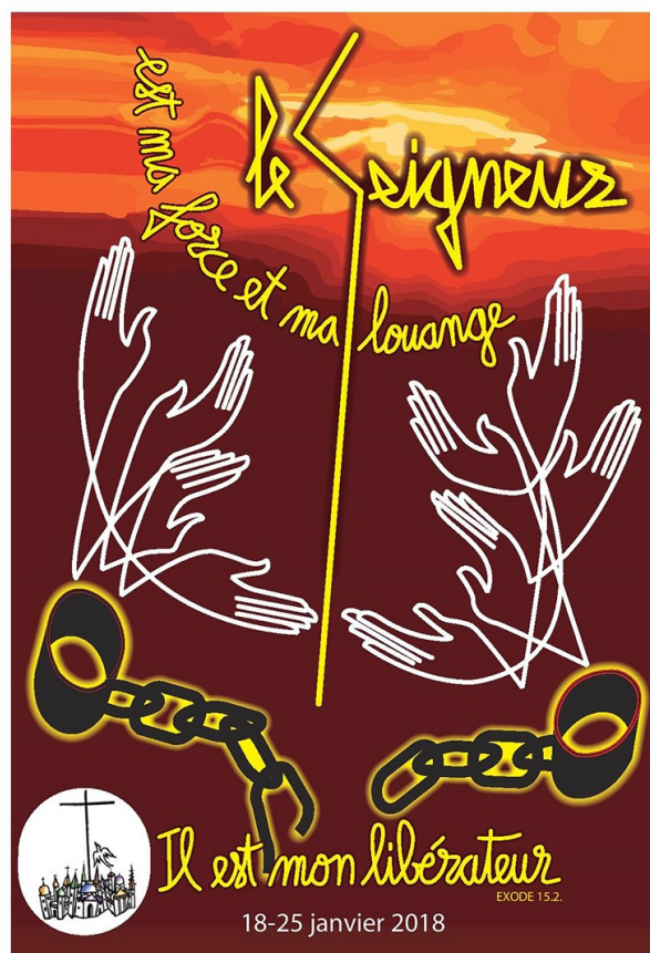
Illustration : François Veyrie Droits réservés : Unité Chrétienne - Lyon - France

Semaine de prière pour l'Unité Chrétienne